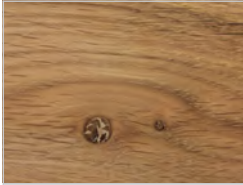
Eiche mit Knoten