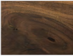
Nussbaum mit Knoten